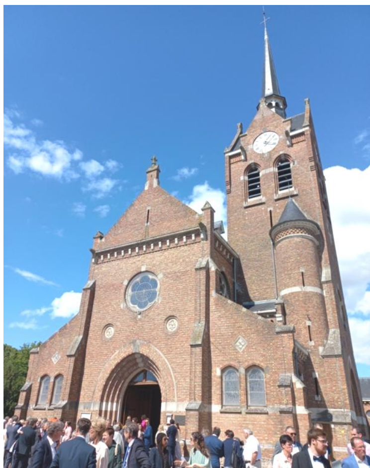
L'église de Fleurbaix, détruite en 1916, reconstruite en 1929