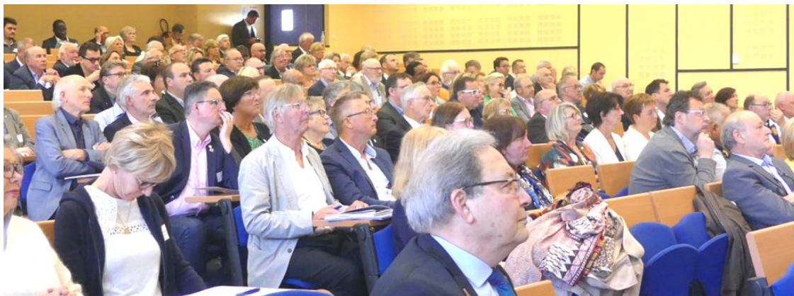
L'assemblée de formation de district